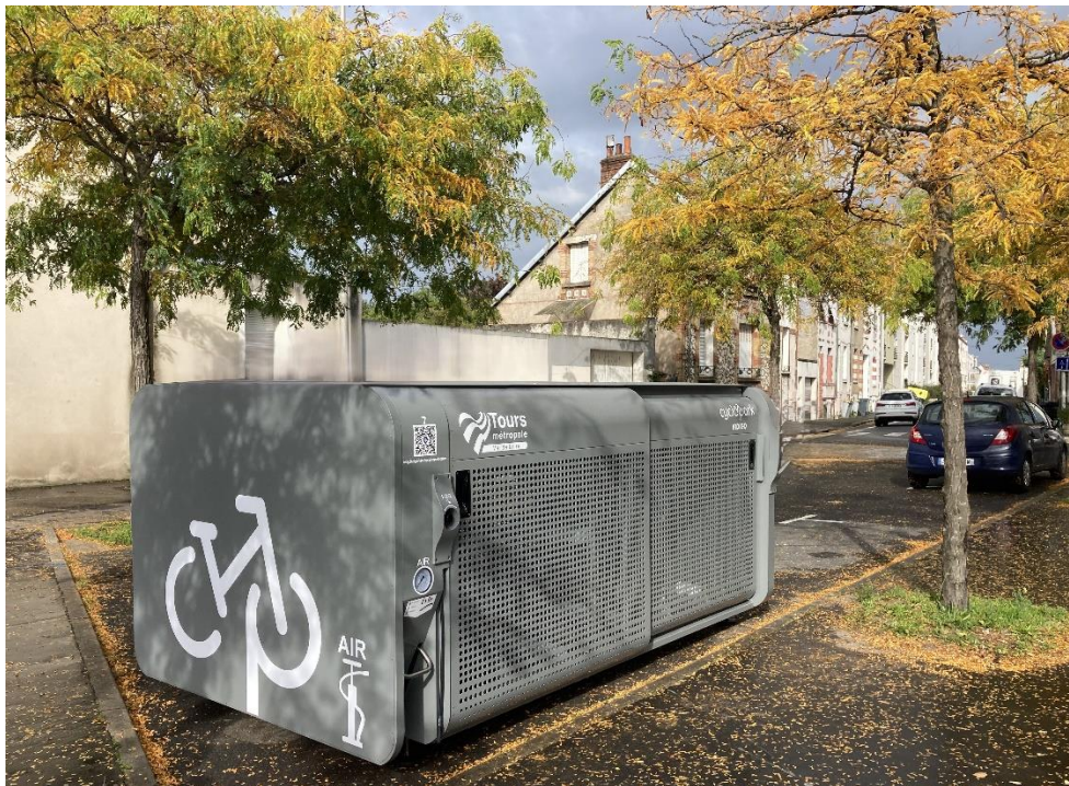
Une des sept Véloboxes installées par INDIGO (278 Rue Édouard Vaillant).