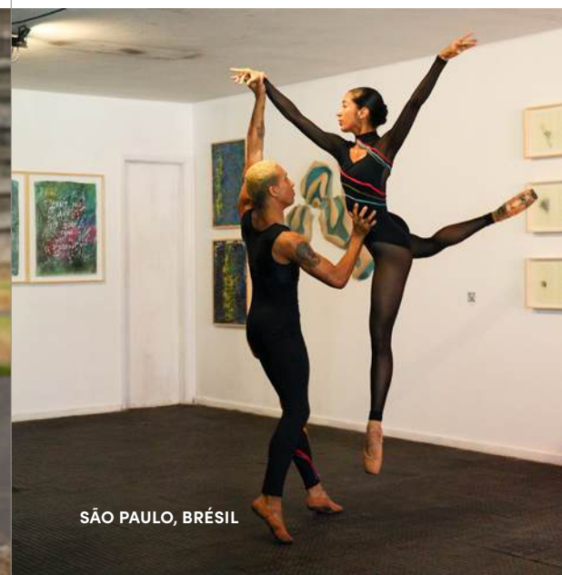
SÃO PAULO, BRÉSIL

Le soutien de la Fondation INDIGO a permis de financer les cours et d'améliorer les équipements afin d'offrir de bonnes conditions d'apprentissage aux jeunes danseurs.