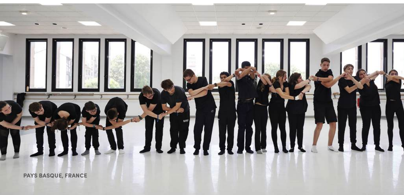
PAYS BASQUE, FRANCE

Le bilan est positif pour les élèves comme pour les enseignants qui en sont ressortis plus unis et sensibilisés aux questions climatiques. Pour preuve : plus de 60 % des collégiens veulent revivre l'expérience d'un spectacle de danse et affirment regarder la nature autrement.